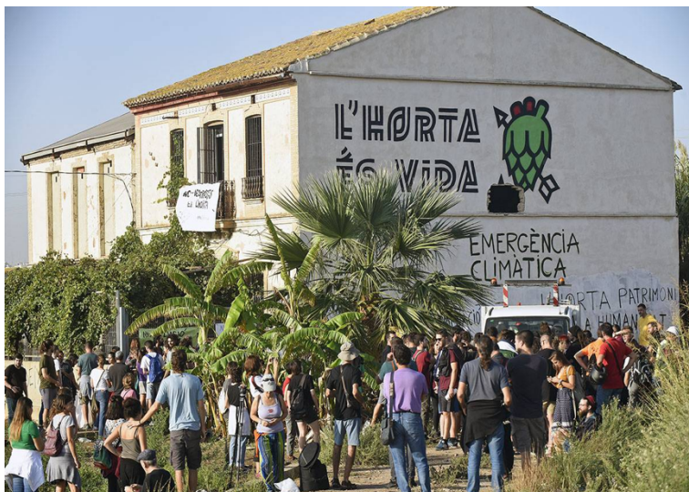
Photo 1. Mobilisation pour la préservation des terres à Valence